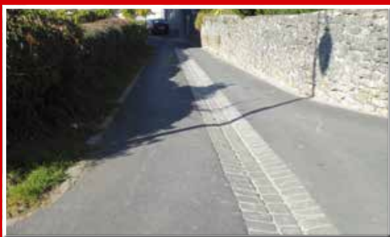
Rue de l'Église