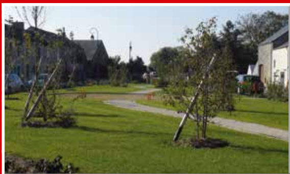
Place des Boucards