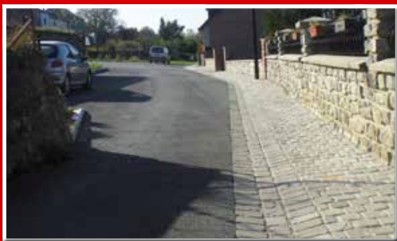
Rue de Vaucelles

La commune a réaménagé entièrement la place et les rues suivantes (rue du Puits, rue du Stade et le chemin de Vaucelles) pour la somme de 447 723,83 € HT. Le conseil municipal a donné son aval quant à l'implantation d'une fontaine au centre de la place, pour la somme de + ou - 50 000 € HT. Des travaux d'aménagement de la rue de l'église ont été réalisés et s'élevent à 106 084,36 € HT.