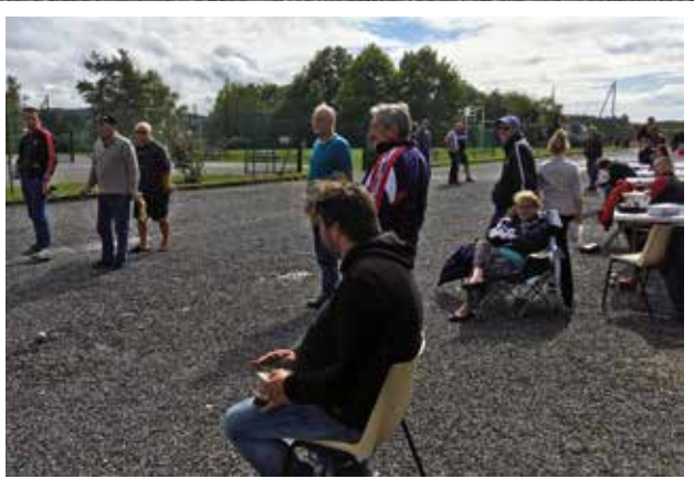
Le samedi après-midi, 22 équipes se sont affrontées lors du concours de pétanque, puis la soirée spéciale « Années 80 » animée par DJ Mouss, s'est poursuivie tard dans la nuit, dans une ambiance de folie.