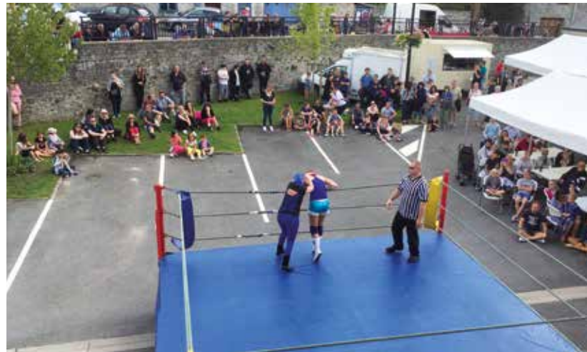
L'après-midi, entre 15h00 et 17h00, plusieurs combats de catch se sont succédés, avant de laisser place à un spectacle animé par un sosie de Patrick Sébastien suivi d'un concert du groupe Humany's.