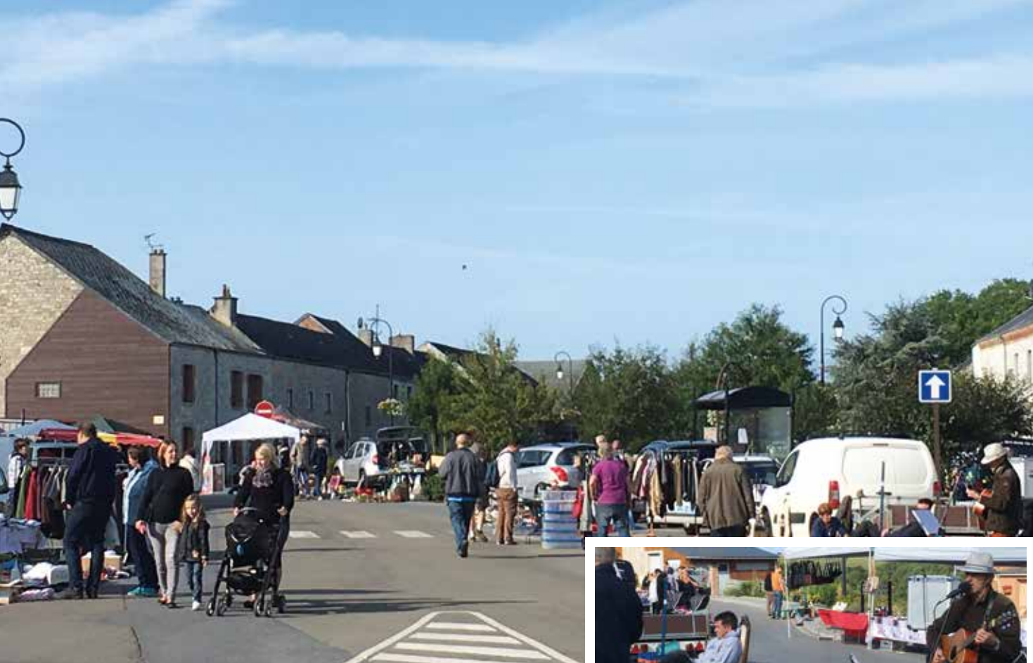
Le dimanche, la traditionnelle brocante regroupait une centaine d'exposants et artisans et a attiré énormément de monde, tout au long de la journée.