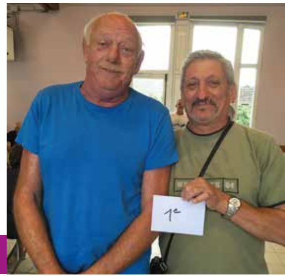
Les gagnants du concours

Le lundi, le traditionnel concours de belote était organisé à la salle polyvalente.