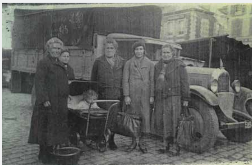
Habitants de Foisches à Tiffauges - 1940

« Et comme mes parents me le rappelaient souvent, des gens de Foisches ont trouvé refuge dans notre maison et notre atelier. Touché par ce livre, j'ai voulu les retrouver, ou tout au moins leurs descendants. C'est pour cette raison, que je suis aujourd'hui à Foisches. »