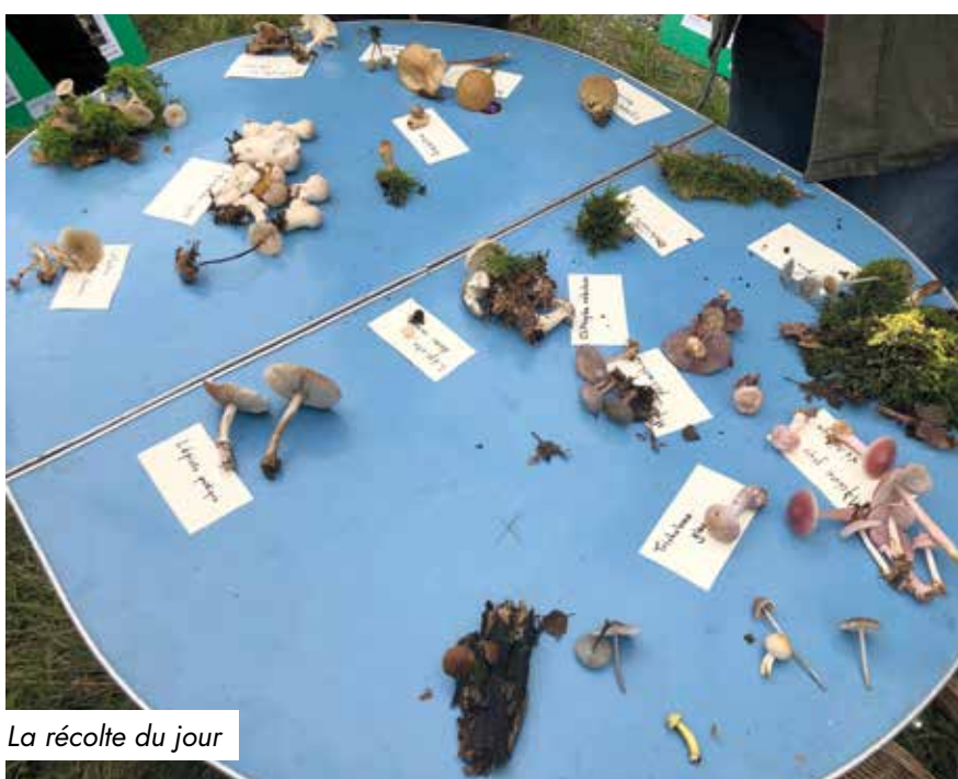
La récolte du jour