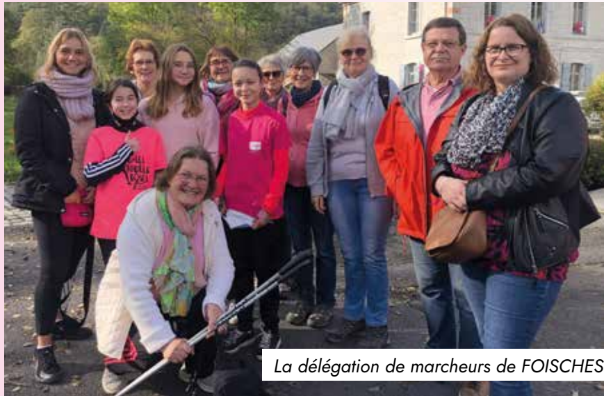
La délégation de marcheurs de FOISCHES

Cette manifestation a permis de récolter 1182,75 € au profit de la ligue. Un bel exemple de collaboration intercommunale.